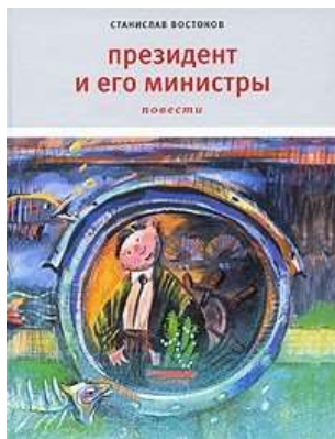
Востоков С. Президент и его министры / С. Востоков. - Москва : Время, 2010. – 156 с.

В 2010 году в издательстве «Время» вышла новая книга Востокова «Президент и его министры». Еще в рукописи в 2008 году книга стала лауреатом премии «Заветная мечта» в номинации «Малая премия».